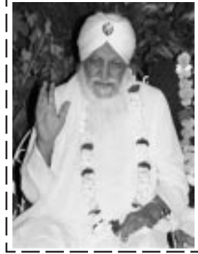
ਸੱਚਖੰਡ ਵਾਸੀ ਸ੍ਰੀ ਮਾਨ